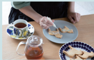
▲クッキーの絵付け体験

クッキーの絵付けやオリジナルのラッピングBOXづくり、「甘いものを食べながらコーヒーを飲む」F I K Å体験などが楽しめます。