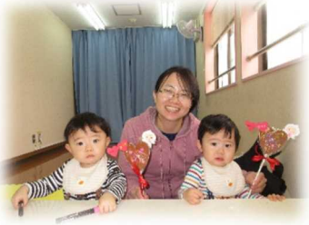
バレンタインのハートステッキを作ったよ。

(講座・通常利用は引き続き電話での予約制です。尚、電話での育児相談も承っています)