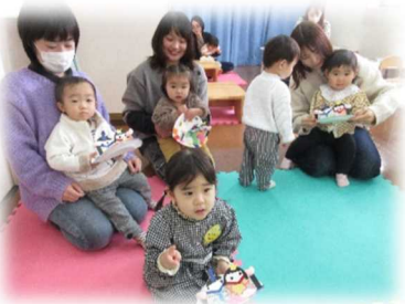
おひな様制作かわいかったです。