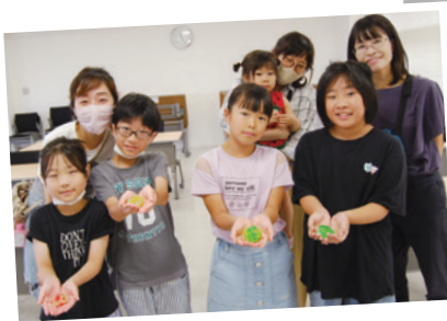
▲個性いっぱい のせっけんが完成