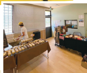
◀人気のパン屋さん