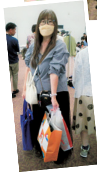
▲たくさん 買いました