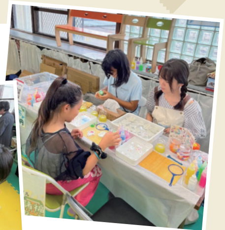
▲大人気のうおーたー ぷにぷに作り