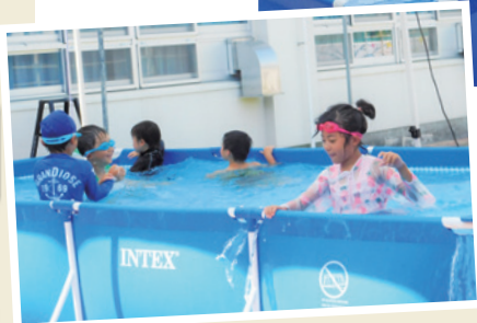
◀気持ちよさそうに遊ぶ子どもたち