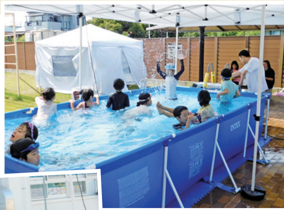
▲熱中症対策のため屋根の下で水遊び