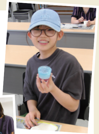
▲宝石みたいで きれい!