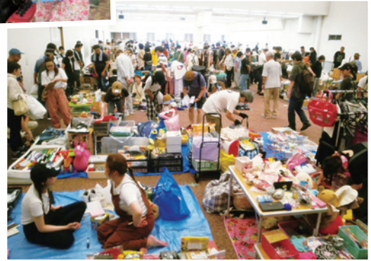
▲会場いっぱいのお客さんです