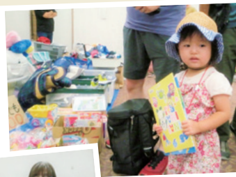
◀かわいいノートを発見！