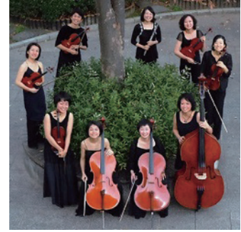
アンサンブル・サビーナ