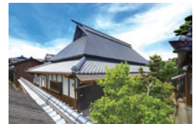
辻本家住宅主屋 (国登録有形文化財)