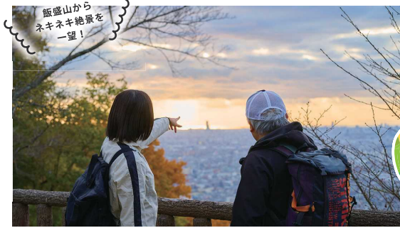
飯盛山から ネキネキ絶景を 一望！

明石海峡大橋まで見渡すビュースポット飯盛山へ、夕焼けを狙ってプチハイキング。ガイドに見どころや展望台を案内してもらい、山頂ではカフェタイム。ドローン撮影もあり！