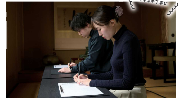
一瞬一瞬に ネキネキ丁寧に