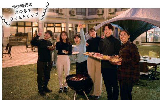
学生時代に ネキネキ タイムトリップ