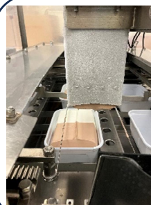
アイスクリーム充填作業