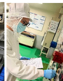
機械装置・設備機器の修理・保全