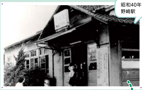
昭和40年代の野崎駅

昔の野崎駅は駅舎が小さく、シンプルな木造の1階建てだったんだね。現在は橋上駅舎になり2か所の出口にロータリーがあって、とてもきれいになったね。隣には大きな自転車駐車場もできて、すごく発展したよ。