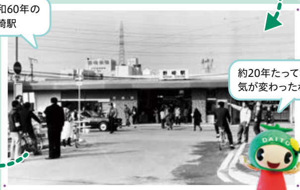
約20年たって雰囲気が変わったね！