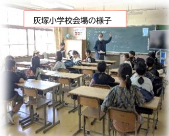
灰塚小学校会場の様子

みんな「同じ進度」で学んでいきます。テキストを使いながら、先生が前に立って、授業を進めます。