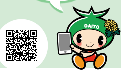
市公式 LINE です