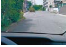
昨年の入賞作品 「次は何が出てくるかな?」