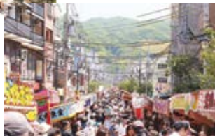
▲多くの人でにぎわう参道