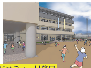
ピロティ・昇降口