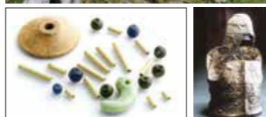
大阪府指定文化財