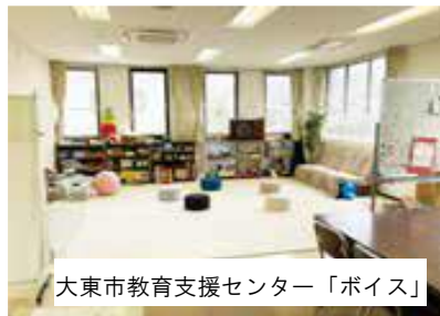
大東市教育支援センター「ボイス」