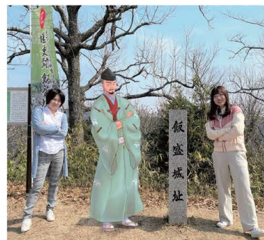
■在山顶、御体家郭分别与三好长庆、松永久秀留影纪念