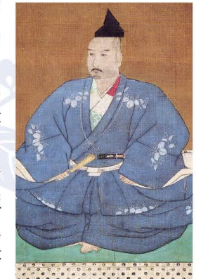
■三好长庆像(大德寺聚光院收藏)

在瑞士人西塞特所著的《日本诸岛史记》中绘有日本地图,其中可见地名“Imoris(饭盛)”与“Sanga(三箇)”。葡萄牙神父陆若汉在《日本教会史》中记载,三好大人(Miyoxidono)曾统掌“天下(Tenca)”,以及地名“饭盛(Ymory)”。此外,荷兰人查特莱恩在《历史地图集》中将织田信长、丰臣秀吉及其子秀赖、三好大人(MIOXIN-DONO)作为日本的统治者进行了介绍。三好长庆与饭盛城虽然已逐渐淡出日本人的记忆,但在欧洲一直是不朽的历史碑文。