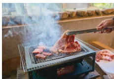
P3・4 アウトドア体験