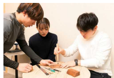
P6・7 ものづくり体験