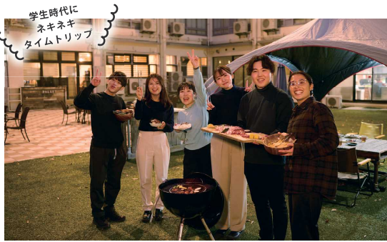
学生時代に ネキネキ タイムトリップ