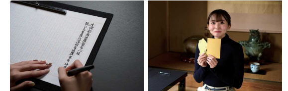
一瞬一瞬に ネキネキ丁寧に