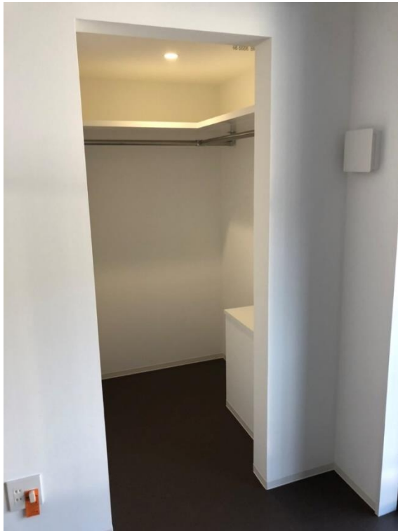
収納(ウォークインクローゼット)