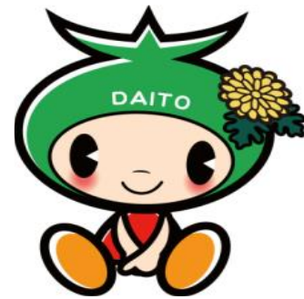
大東市マスコットキャラクター 「ダイトン」

大東市役所 都市経営部 市営住宅管理課 電話 072-870-0480 (直通)