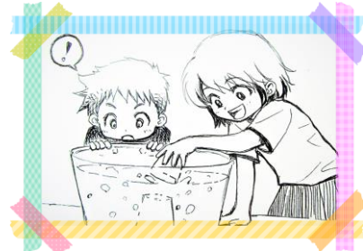
水と空気の不思議

空気って目には見えないけれど、いろんなところにいるんだよ。 そして、水の中にも、ちょっとふしぎな力がはたらいているんだ。 透明なバケツと水、そしてペットボトルを使って、水と空気の 「おもしろい関係」を探ってみよう!